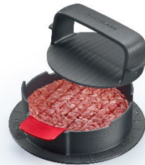
Hamburgermaker »Vario Plus« Art.-Nr. 62352260