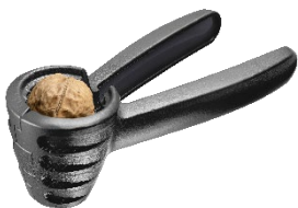
Nussknacker »Westmark Nussprofi« Art.-Nr. 33222270

... und kommt so direkt zur nächsten Neuheit. Der neue Hamburgermaker darf bei eben diesem Grillabend natürlich nicht fehlen. Er formt mühelos 3 unterschiedliche Patty-Größen und ermöglicht somit das Herstellen perfekter Portionsgrößen für jeden Geschmack. Einem gelungenen Abend mit Freunden und der Familie steht somit nichts mehr im Weg.