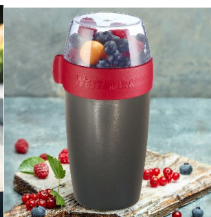
Lunchpot, 1150 ml Art.-Nr. 52872260